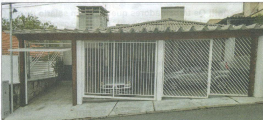
Fachada da nova sede do sindicato, na Rua Maria de Castro Mesquita, 50